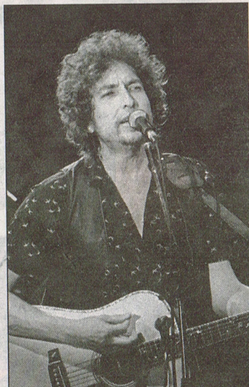
I DRAMMEN: Bob Dylan.

(Jeg hadde nettopp lest i «Art News» at et Andy Warhol-maleri som tilhørte Bob Dylan skulle på auksjon i New York. Etter omfattende restaurering for skader det var påført som pilkastings-mål.)